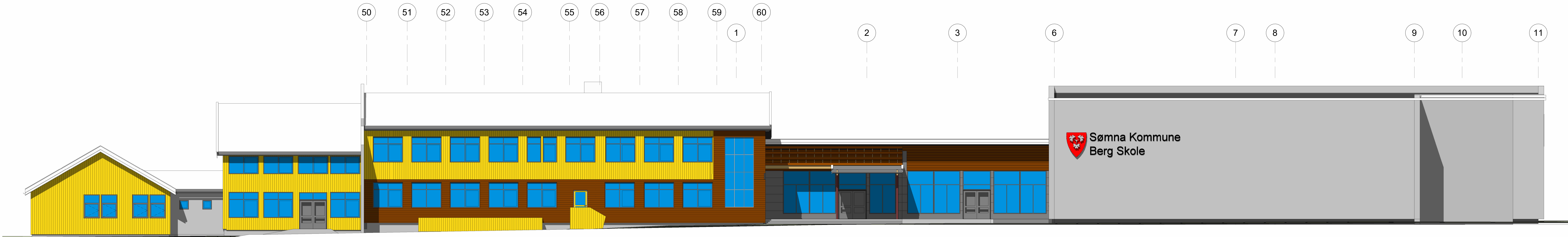
A32-01 SørØst 2026 1 : 100